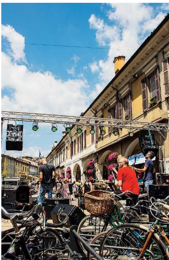
A caccia di suoni. Palchi allestiti ovunque in città per la Festa della Musica